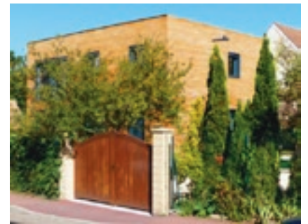
Maison écologique passive Lauréate en 2015

C'est pour valoriser les travaux de rénovation ou de construction neuve performante et ainsi encourager la diffusion des bonnes pratiques que le Concours Maison Économique a été lancé en 2007. Depuis 10 ans maintenant, il a permis aux habitants des Yvelines de découvrir de nombreuses maisons BBC ou passives et des porteurs de projets très impliqués dans la réduction de l'impact de l'être humain sur nos émissions de gaz à effet de serre. Constructions en bois, toitures végétalisées, isolation thermique par l'extérieur et chaudières biomasses sont autant de techniques qui ont été mises en lumière grâce au concours et la participation active et passionnée des participants !